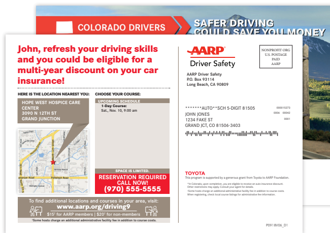
Mailingbeispiel Rückseite AARP Driver Safety mit personalisierter Karte von locr und GEOService Zuweisung des nächstgelegenen Standorts

AARP Driver Safety setzt auf standortbasierte Kunden-Ansprache