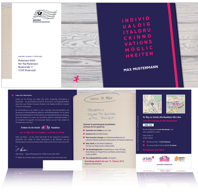
Layout der einfachen Version der d2b-Einladung.

Die E-Mail-Einladungen gingen an die zweite Hälfte der Adressaten und zusätzlich an Kunden und Interessenten, die von den Veranstaltungsorten recht weit entfernt leben und arbeiten, so dass die Wahrscheinlichkeit einer Teilnahme deutlich geringer war. „Bei den E-Mails gab es entsprechend der Printeinladungen wiederum drei Varianten für die drei Zielgruppen, die sich aber vom Layout nur marginal voneinander unterschieden. Inhaltlich wurde wieder mit Text- und Bildvariablen gearbeitet.“