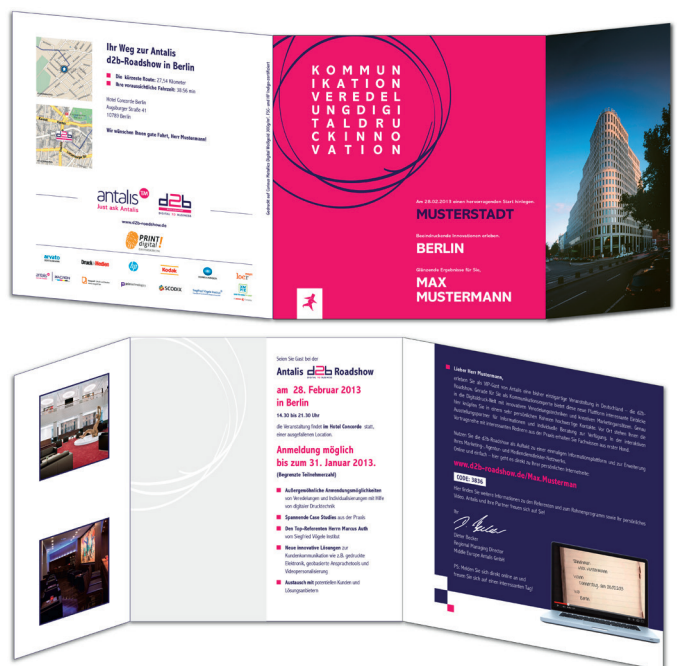
Layout der High-End-Version der d2b-Einladung.

Die Idee war, nicht nur in eigener Sache Werbung zu machen, sondern das Interessante mit dem Nützlichen zu verbinden. „Neben den unterschiedlichen Gestaltungsvarianten wollten wir auch unterschiedliche Mailingformen erstellen. Antalis hat sich im Prinzip für zwei Gestaltungsvarianten entschieden und diese haben wir dann in Vergleichsgruppen aufgeteilt.